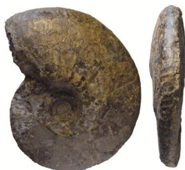
北西太平洋地域最古のパキディスカス属； パキディスカス・エクセルサス Pachydiscus excelsus 佐々木登氏寄贈

加えて、今回発見されたパキディスカス・エクセルサス Pachydiscus excelsus は北西太平洋地域のパキディスカス属の中で最古のものであり、その進化や系統について考える上で重要であることが明らかになりました。