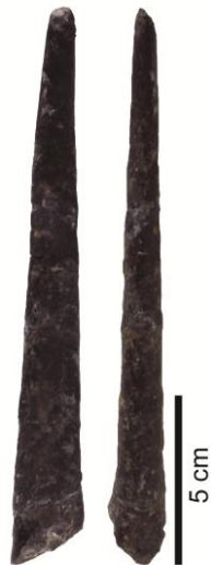
カンパニアン階上部のバキュリテス・レックス帯の化石； バキュリテス・レックス Baculites rex 伊豆倉正隆氏寄贈