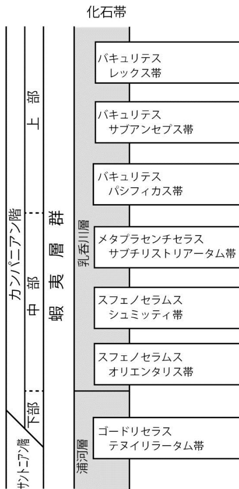
里平地域で確認された化石帯