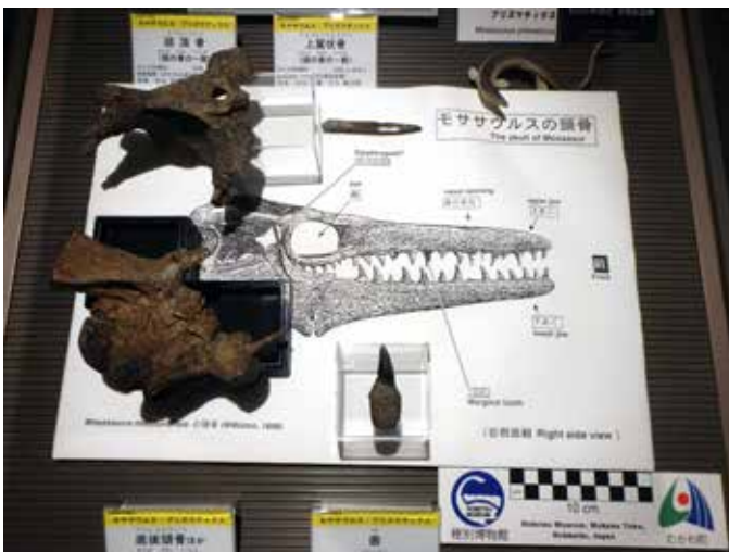
モササウルス・プリズマティクス化石

これは、日本産モササウルス類の数少ない頭骨の一つであることと、新種であるとされた点で重要な化石です。これまでに日本産および北西太平洋地域産のモササウルス類は4種のみ(1985年発表の