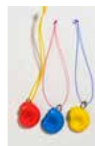
アンモナイト レプリカアクセサリー