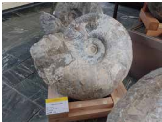
大型アンモナイト メソプゾシア（小平町産） 常國万吉氏（岩見沢市）寄贈