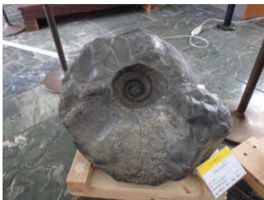
大型アンモナイト アナパキディスキス（夕張市産） 長谷川浩二氏・松田昇一氏（三笠市）寄贈