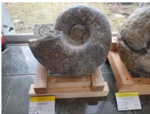
大型アンモナイト アナパキディスキス（むかわ町穂別産） 鈴木剛氏（苫小牧市）寄贈