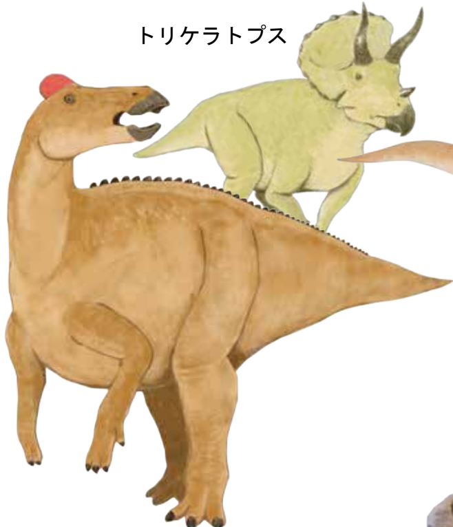
エドモントサウルス