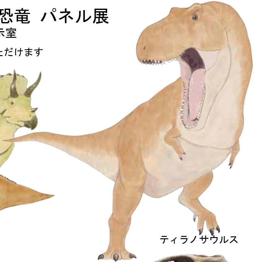
ティラノサウルス