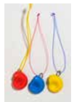
アンモナイト レプリカアクセサリー