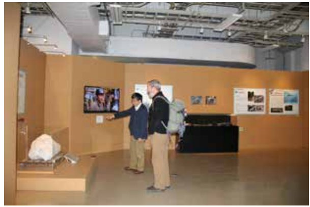
恐竜化石入り石こうジャケット、発掘の映像、発掘道具（第2会場）

東京会場（会期 3/8～6/12）で 50 万人程度の観覧者数が期待されている恐竜博 2016 ( http://dino2016.jp/ ) に当館のハドロサウルス科恐竜右大腿骨と、発掘道具などが展示されています。大腿骨以外は、北九州会場（7/9～9/4）・大阪会場（9/17～1/9）でも公開されます。東京会場会期内の 4/5～6/1 には北海道大学の学生による当館ハドロサウルス科恐竜化石のクリーニング実演も公開されます。