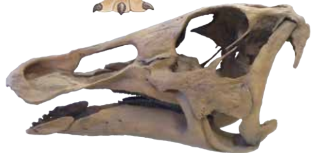
エドモントサウルス頭骨レプリカ