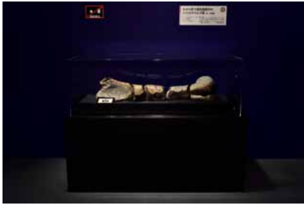
ハドロサウルス科恐竜大腿骨（右）