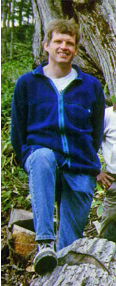
フィリップ・カリー博士 (1992 年穂別町 [当時] 訪問時)