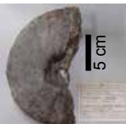
穂別産パキディスカス・グラシリスのタイプ標本 (ホロタイプ) 九州大学理学部所蔵

パキディスカス・グラシリスは、1979年にむかわ町穂別地区（当時は穂別町）キウス産ほかの標本を元に新種として記載されたアンモナイト（文献1）で、北西太平洋地域のマーストリヒチアン期前期の後期（約7,100万年前）の示準化石（地質年代を決定できる化石）です。1979年は穂別博物館が設立される以前でしたので、新種の基準とされたタイプ標本は、研究が行われた九州大学理学部に収蔵されました。新種発表時は、穂別地域からは7個体、中頓別町から2個体が報告されました。2005年には、サハリンからも数個体の産出が報告されました（文献2）。