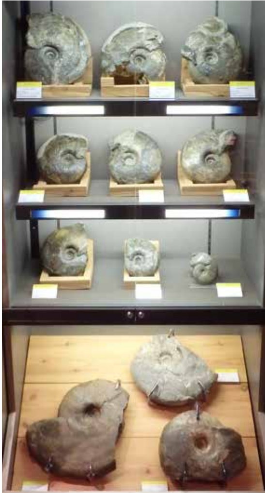
博物館常設展示室奥にあるパキディスカス・グラシリスのコレクション