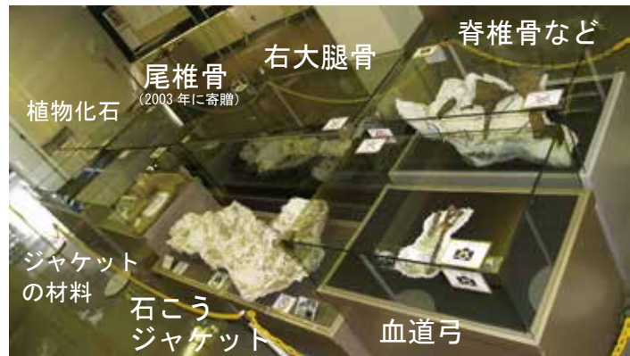
一次発掘で採集された恐竜化石など

穂別恐竜発掘展が7/19から公開されています。この展示では、穂別産恐竜を推定されている実物大サイズで印刷したもの（骨格図は同じハドロサウルス科のオロロティタン）を展示しました。また実物大サイズの化石産状写真も展示しています。一次発掘で採集され、クリーニング済みの標本として、右大腿骨などを展示しました。この恐竜の大きさが実感できる展示になっています。