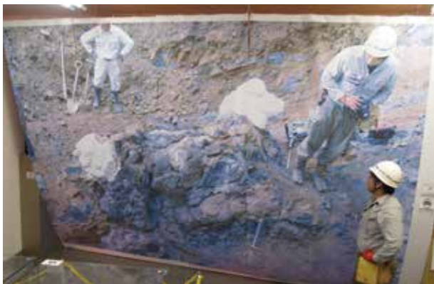
実物大サイズの化石産状写真