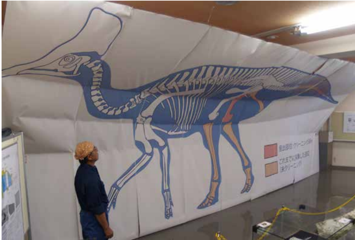
実物大サイズの穂別産恐竜（骨格図はロシアのオロロチタン）