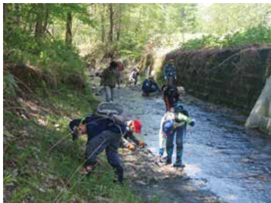
昨年の化石採集会の様子