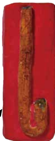
Phylloptychoceras horitai フィロプチコセラス・ホリタイ

2013年に新種として発表されたアンモナイト フィロプチコセラス・ホリタイのレプリカ