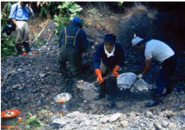
1993年の発掘の様子 化石周辺の余分な土砂をどけているところ