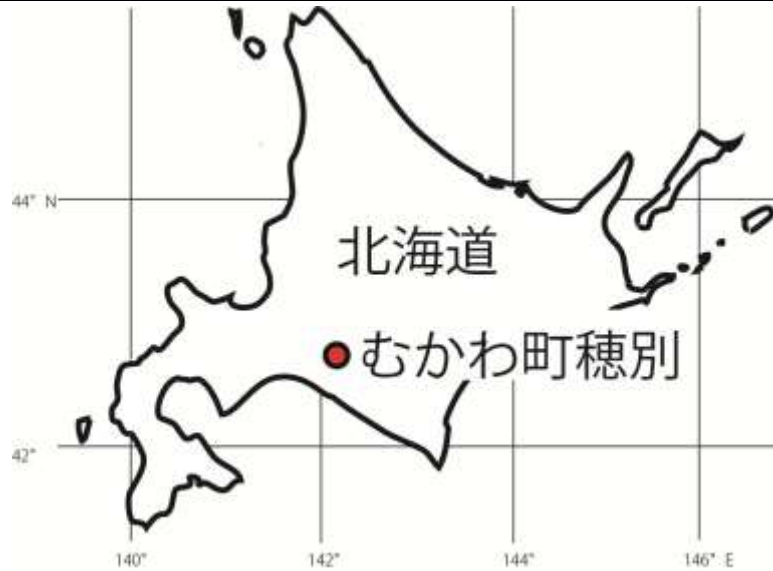
図 1 : むかわ町穂別の位置図