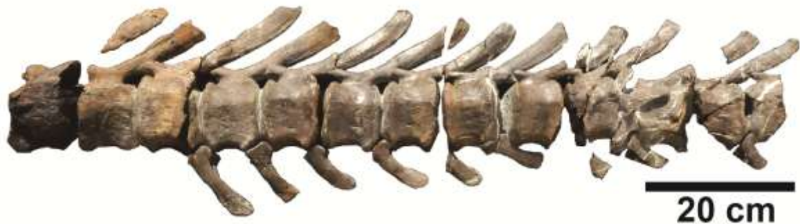
図 2 : 平成 25 年 7 月に報告された恐竜の尾椎骨化石

平成 25 年 9 月～10 月には、北海道大学と穂別博物館で第一次穂別恐竜発掘を行い、その成果について、平成 26 年 1 月に兵庫県立人と自然の博物館で開催される「日本古生物学会第 163 回例会」において発表します。