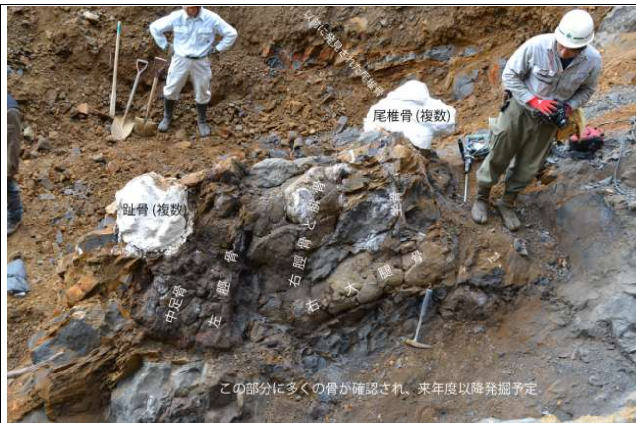
図4：平成25年9～10月の発掘風景。確認された主な骨の名称（部位名）を示している。 これら以外にも多くの骨が含まれており、今後のクリーニング作業が必要。