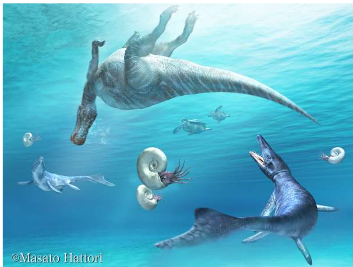
図5：穂別産の恐竜の遺骸が流されている様子の復元画（©服部雅人）