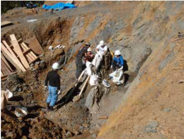
化石の回収が進んだ頃。化石の無い部分を削り、化石に石こうジャケットをかぶせながら作業を進めました。(9/28)