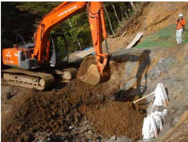
今回の発掘で採りきれなかった部分は、補強して埋めました。(10/5)