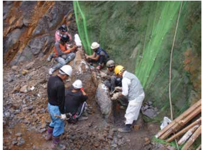
今回の発掘で主要な部分を回収し終えたころ(10/2)