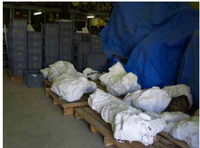
今回の発掘で回収した恐竜化石と共産化石。手前が回収した石こうジャケット。奥にある灰色のプラスチックの箱にも回収した化石が入っている。

今回の発掘は、10月初旬までを予定していましたので、9月20日ごろからは、表面を露出させた骨化石とノジュールの回収を進めました。骨の入っていない部分を削り、ジャケットを制作しながら化石の回収をすすめました。骨を露出させたものの、回収できなかった部分についてはジャケットで補強し、埋め戻しました。これらについては、来年度(今年)に改めて回収する予定です。