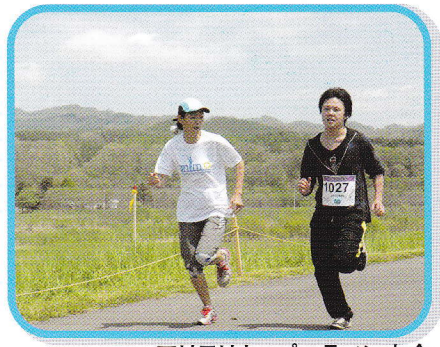
アリモリカップマラソン大会