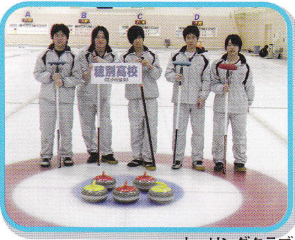
カーリングクラブ