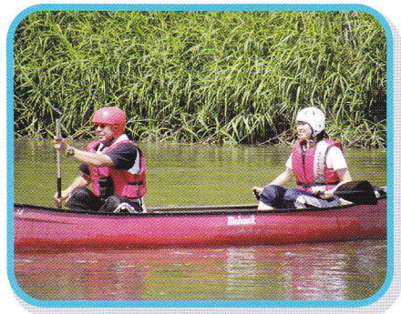
保護者宿泊体験(カヌー)

また、穂別高校との連携を図りながら学習支援や舎監・生活指導員等による生活相談も行い、寮生をしっかりとサポートしています。